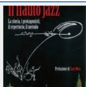
Stefano Benini - "Il flauto jazz"

Questi due volumi sono accomunati da un dato di fondo - l'amore degli autori per i propri strumenti (rispettivamente flauto e chitarra) - mentre si differenziano notevolmente quanto a modalità di scrittura e approccio alla materia trattata.